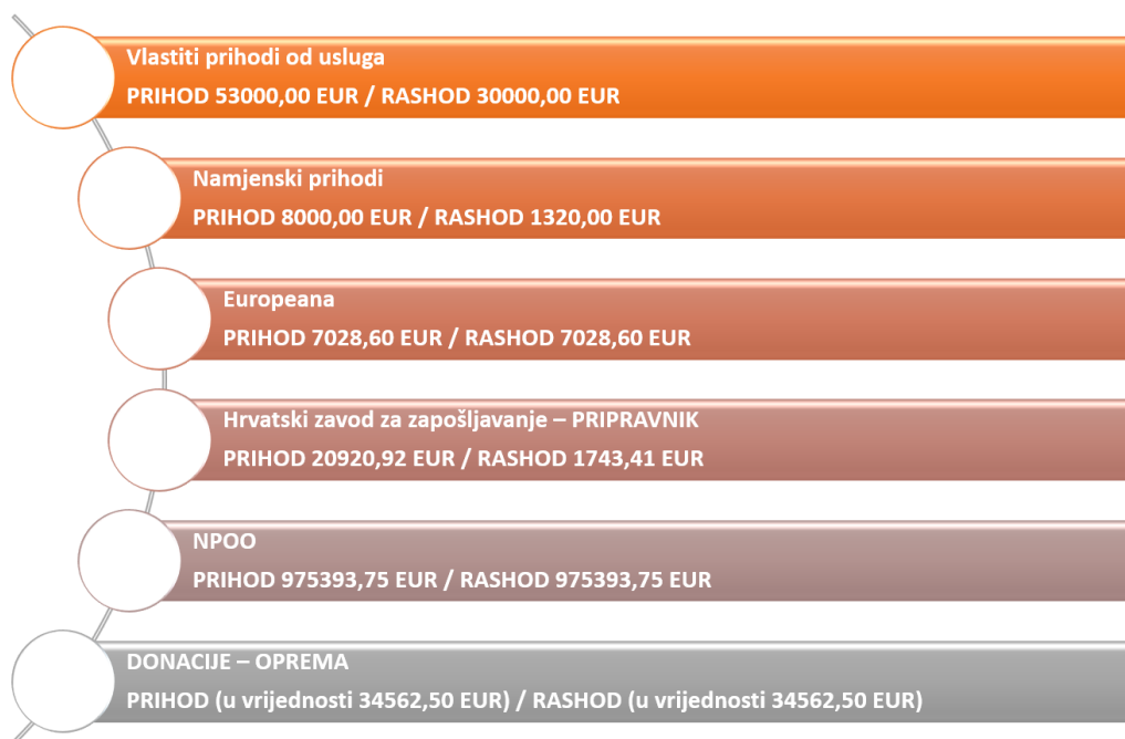
Sl. 4. Prikaz vlastitih sredstava i NPOO-a za 2024. g.

Izvršen je obračun i isplata sljedećih materijalnih prava zaposlenika: 9 jubilarnih nagrada, 3 solidarne pomoći, 1 pomoć za rođenje djeteta, 3 otpremnine, 1 pomoć zbog invalidnosti malodobnog djeteta, dar djeci za Svetog Nikolu za 9 zaposlenika, naknada za neiskorišteni godišnji odmor za 2 djelatnika te uskrsnica, regres i božićnica za sve zaposlenike. Također, isplaćen je i dar u naravi – bon za sve zaposlenike iz vlastitih sredstava.