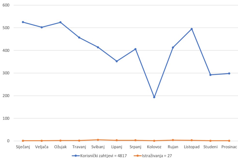
Sl. 2. Prikaz mjesečnih korisničkih zahtjeva 2024. g.