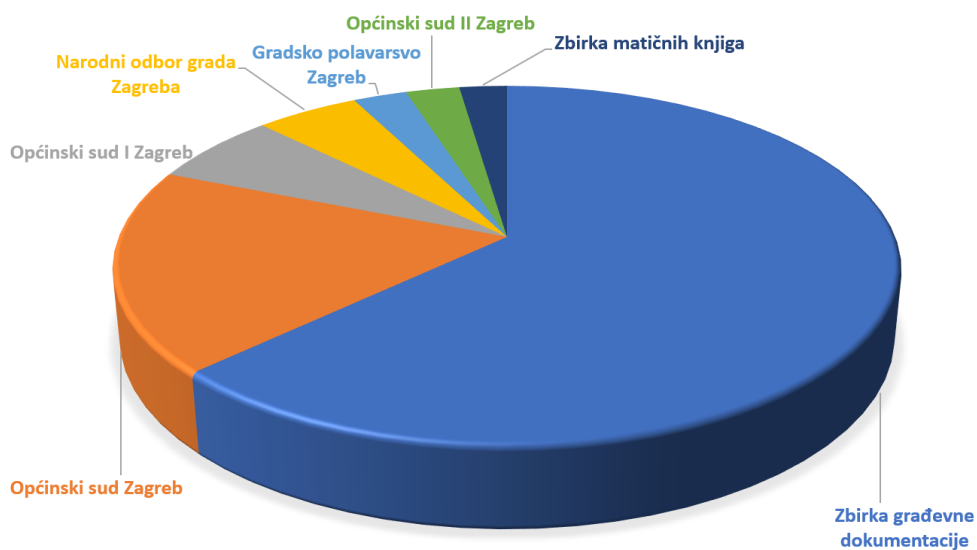
Sl.1. Prikaz najviše istraživanih fondova 2024. g.