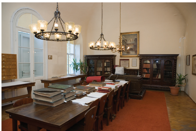
L'antica sala lettura dell'Archivio

previo avviso telefonico al numero: 01 4807 167