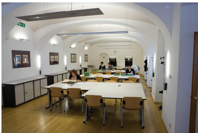
La Nuova sala lettura dell'Archivio

Durante l'anno in media 1700 utenti visita l'Archivio e si risponde a circa 6000 richieste diventando così il secondo archivio più visitato in Croazia, subito dopo l'Archivio di Stato Centrale.