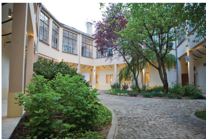
Il palazzo Erdödy-Drašković e il cortile interno del palazzo