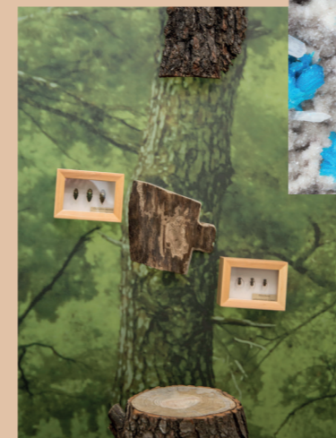
Superorganizam – snage života socijalnih kukaca

Od bogate izložbene djelatnosti Prirodoslovnog muzeja, ovom izložbom istaknuli smo neke od njih: Fosili u protoku vremena i umjetničkoj impresiji, Superorganizam – snage života socijalnih kukaca, Koralj izvađen iz mora, Savršenstvo evolucije – Razotkrivanje i Zbirka mekušaca Mikula.