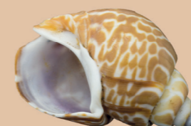
Zbirka mekušaca Mikula