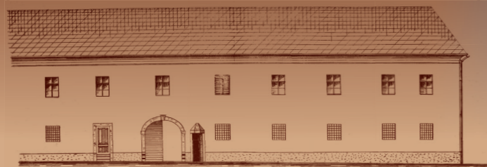
Nacrt pročelja zgrade Muzeja grada Zagreba. HR-DAZG-1122 Zbirka građevne dokumentacije, R 153.

Događanje pod nazivom Žive slike u Muzeju grada Zagreba zaživjelo je prvi put 2000. godine u vrijeme posljednje subote i nedjelje prije dana fašnika uoči korizme. To je ujedno bio prvi izazov uvođenja muzeološke interpretacije i prezentacije metodom žive povijesti ( living history ) u našim muzejima.