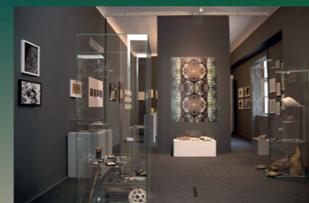
Superorganizam – snage života socijalnih kukaca

Tako se i danas osnovna stručna djelatnost Muzeja odvija u njegovim odjelima: Zoološkom, Botaničkom, Mineraloško-petrografskom, Geološko-paleontološkom i Preparatorsko-restauratorskom, što sve čini današnji Hrvatski prirodoslovni muzej.