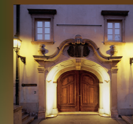
Ulazni portal. Galerija Klovićevi dvori.