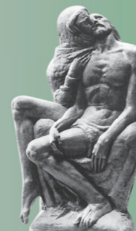
HR-DAZG-857 Zbirka Uličnik Ivan, 1390.

Ivan Meštrović stekao je svjetsku slavu i ugled te je utjecao na generacije kipara i umjetnika uopće. Njegova djela čuvaju se u muzejima, galerijama i zbirkama diljem svijeta, kao i na mnogim javnim mjestima, gdje njegovi spomenici i danas oduševljavaju svojom monumentalnošću. Među njima su svakako kip Evanđelista Marka u crkvi sv. Marka u Zagrebu, polaganje u grob u vosku, te glavni oltar s križem u crkvi sv. Marka. Naravno, tu je nezaobilazni Zdenac života smješten ispred Hrvatskog narodnog kazališta u Zagrebu.