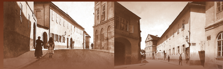
Zgrada Muzeja grada Zagreba.

Muzej grada Zagreba utemeljila su Braća Hrvatskoga zmaja 1907. godine, a bio je smješten u kuli nad Kamenitim vratima zajedno s gradskim arhivom i knjižnicom. Danas je smješten u obnovljenom spomeničkom kompleksu bivšeg samostana Klarisa iz 1650. godine, na zagrebačkom Gornjem gradu. Muzej obrađuje teme iz kulturne, umjetničke, ekonomske i političke povijesti grada u kontinuitetu od rimskih nalaza pa sve do modernog doba. Fundus čini 75 000 predmeta sistematiziranih u zbirke umjetničkih i uporabnih predmeta karakterističnih za grad i njegovu povijest. Muzej ima vrlo bogat fond vrijedan za proučavanje zavičajne, lokalne prošlosti. Muzejska građa razvrstana je u pet memorijalnih zbirki, dvadeset zbirki predmeta te šest dokumentacijskih fondova. Posebno se ističu kao vrijedan povijesni izvor za proučavanje povijesti Grada sljedeće zbirke: Pretpovijesna arheološka zbirka, Srednjovjekovna arheološka zbirka, Zbirka cehalija, Zbirka planova i regulacija grada Zagreba te Arhivalije.