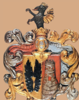
HR-DAZG-872 Zbirka tiskovina, 196.