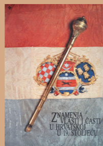
HR-DAZG-872 Zbirka tiskovina, 195.

Hrvatski povijesni muzej zbog nedostatnih prostornih uvjeta nikad nije ostvario stalni postav, no ovom prilikom predstavljamo dio bogate izložbene djelatnosti Hrvatskog povijesnog muzeja. Neke od njih su: Grbovi, grbovnice, rodoslovlja, Ratkaji Velikotaborski u hrvatskoj povijesti i kulturi 1502.-1793., Znamenja vlasti i časti u Hrvatskoj u 19. stoljeću.