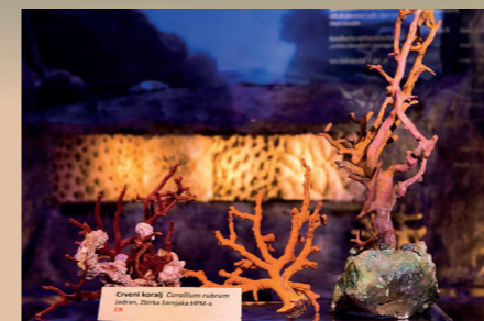
Koralj izvađen iz mora

Od bogate izložbene djelatnosti Prirodoslovnog muzeja, ovom izložbom istaknuli smo neke od njih: Fosili u protoku vremena i umjetničkoj impresiji, Superorganizam – snage života socijalnih kukaca, Koralj izvađen iz mora, Savršenstvo evolucije – Razotkrivanje i Zbirka mekušaca Mikula.