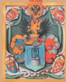
HR-DAZG-872 Zbirka tiskovina, 210.

Za svaku pohvalu je projekt Sjećanja na 20. stoljeće – izbor dokumenata iz osobnih i obiteljskih ostavština HPM-a.