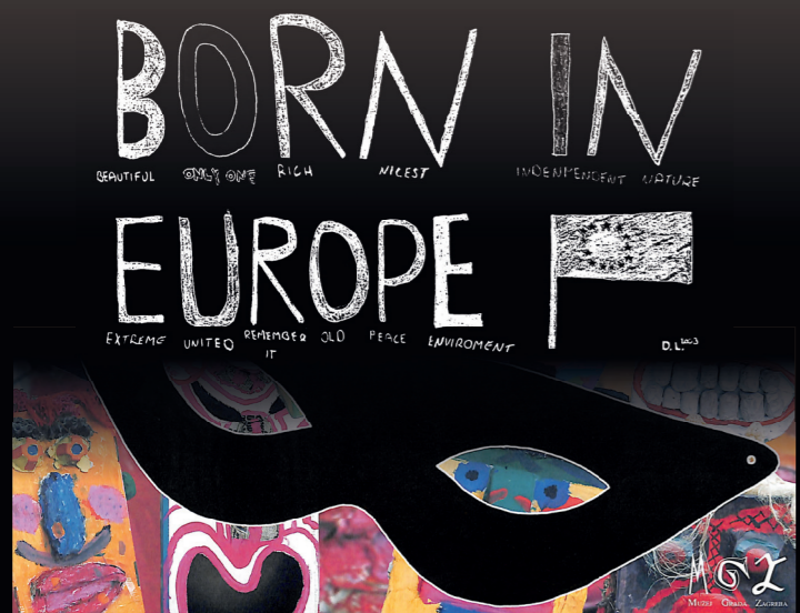
HR-DAZG-872 Zbirka tiskovina, 1201, 677.