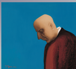
Ivan Generalić - Autoportret, Self-Portrait, 1975, HMNU 661.