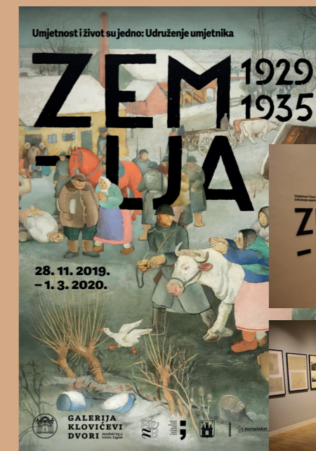
Plakat aktualne izložbe.

Trenutno je na prvom katu postavljena izložba Umjetnost i život su jedno: Udruženje umjetnika Zemlja 1929. – 1935. , a otvorena je do 01. ožujka 2020. godine.