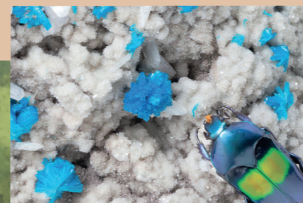
Savršenstvo evolucije - Razotkrivanje