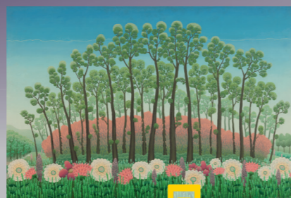
Ivan Rabuzin - Velika šuma, 1966.

Ivan Rabuzin (1921. - 2008.) klasik je hrvatske moderne umjetnosti te jedan od najvećih lirskih slikara 20. st. Cvijet je Rabuzinu simbol sunca i života, atribut neprestana rađanja i mladosti, sveopće harmonije, simbol rajskog.