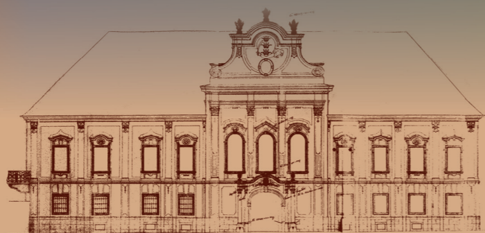
HR-DAZG-1122 Zbirka građevne dokumentacije, R 154.

Djelatnost muzeja odvija se na dvije lokacije u Zagrebu: u baroknoj palači u Matoševoj 9 i u dijelu Meštrovićeva paviljona na Trgu žrtava fašizma. Izložbeni i svi drugi programi otvoreni za javnost, ostvaruju se u palači muzeja u Matoševoj ulici. Muzej je, naime, od 1959. godine privremeno smješten na Gornjem gradu, u palači Vojković-Oršić-Kulmer-Rauch, nakon seljenja Gradskog magistrata, i to je do danas jedini dom HPM-a.