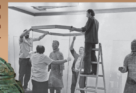
Postavljanje izložbe Drevna kineska kultura.

Najposjećenija izložba Galerije je otvorena 1984. pod nazivom Drevna kineska kultura .