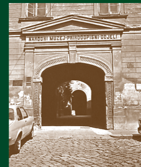
Fotografija ulaza u Prirodoslovni muzej. HR-DAZG-866 Zbirka fotografija, 2964.

Vremenom su se skromne zbirke kurioziteta povećavale, a posebni zamah u prikupljanju prirodoslovne građe nastavljen je djelovanjem vrsnih hrvatskih prirodoslovaca, profesora Zagrebačkog sveučilišta i naših prvih učenih muzealaca Spiridona Brusine, Gjüre Pilara i Dragutina Gorjanovića-Kramberegera, utemeljitelja raznovrsnih prirodoslovnih disciplina i posebnih muzejskih specijalističkih odjela – prirodopisnih odjela Narodnog muzeja.