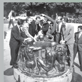
HR-DAZG-866 Zbirka fotografija, 889.

Sabor Republike Hrvatske 1991. godine donosi Zakon o Fundaciji Ivana Meštrovića i time objedinjuje Darovnicu u jedinstvenu organizaciju s administrativnim središtem u Zagrebu. Izmenom Zakona 2007. godine Fundacija Ivana Meštrovića preimenuje se u Muzeje Ivana Meštrovića, a administrativno središte seli se u Split.